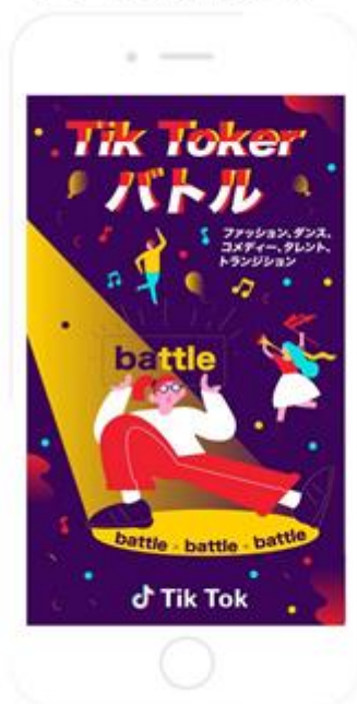
アプリ起動画面広告